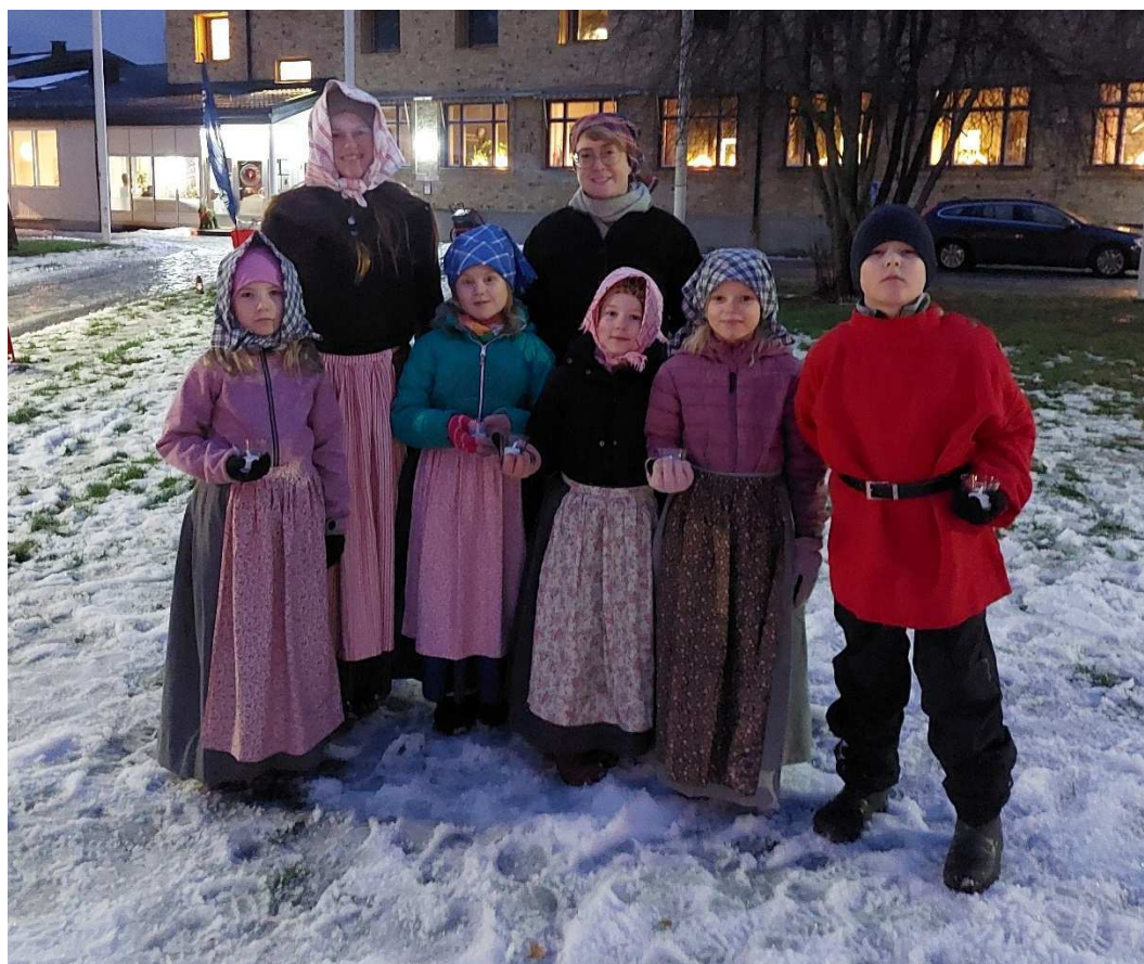
Duktiga barn och mammor som dansade Ljusdans tillsammans med Herrskapsdansarna

Under hösten har vi fortsatt dansa danser med olika svårighetsgrad och även lagt in någon lek och sångdans varje gång. Föräldrar har varit till stor hjälp. Vi har dansat under 15 måndagar och avslutade sedan med att andra advent dansa ljusdans tillsammans med Herrskapsdansarna på julmarknad i Sunderbyn.