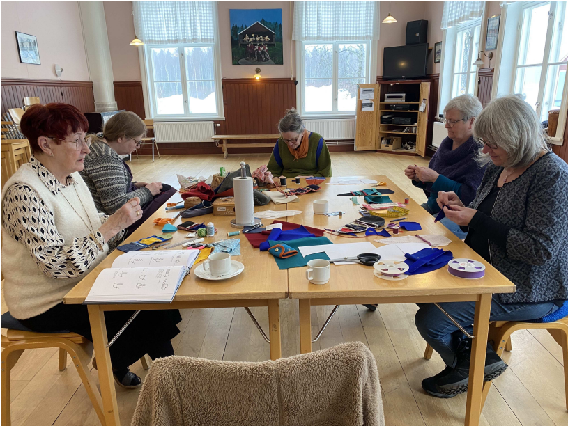
Bilder från tillverkningen av nålbrev, Gudrun fotade.